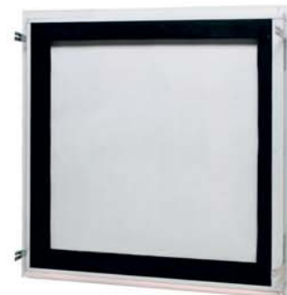
geprüft bis 600 x 600 mm

NEU: Jetzt auch in „luft- und staubdichter Ausführung“